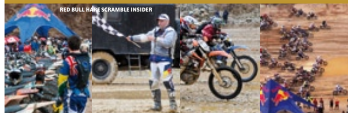
RED BULL HARE SCRAMBLE INSIDER

Als besonderes Souvenir erhalten Sie ein von den Topfahrern signiertes, exklusives Präsent. Streng limitiert und einzigartig - und nur für SPECIAL GUEST PLATIN Kunden!