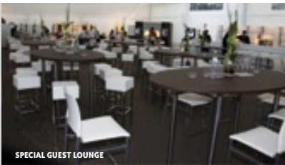
SPECIAL GUEST LOUNGE